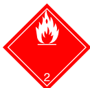
Etiqueta 2.1 : Gas inflamable.