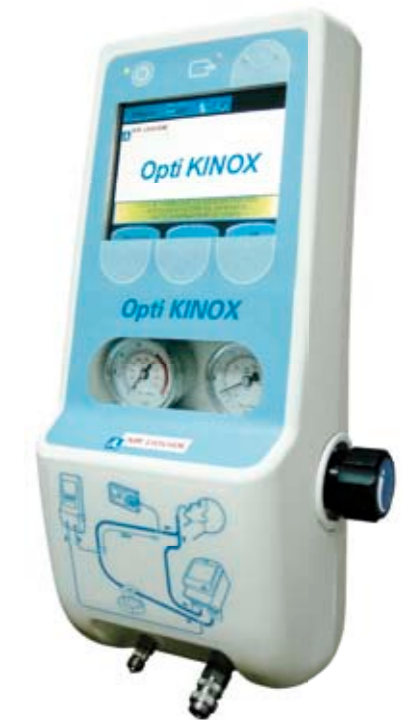
Opti KINOX™ - Ref.: 117692