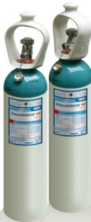
VasoKINOX™ - Ref.: M4947M20L2A001