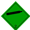
Etiqueta 2.2 : Gas no inflamable, no tóxico.